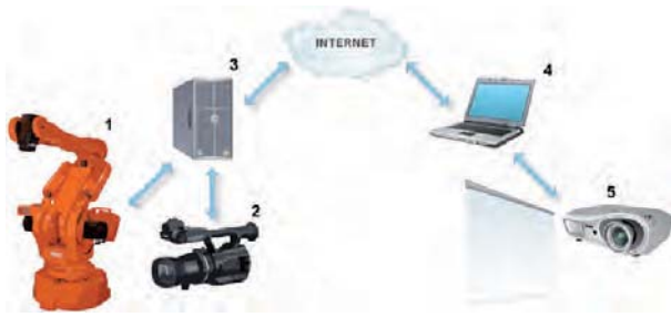
Rys. 1. Architektura wirtualnego laboratorium VITRALAB