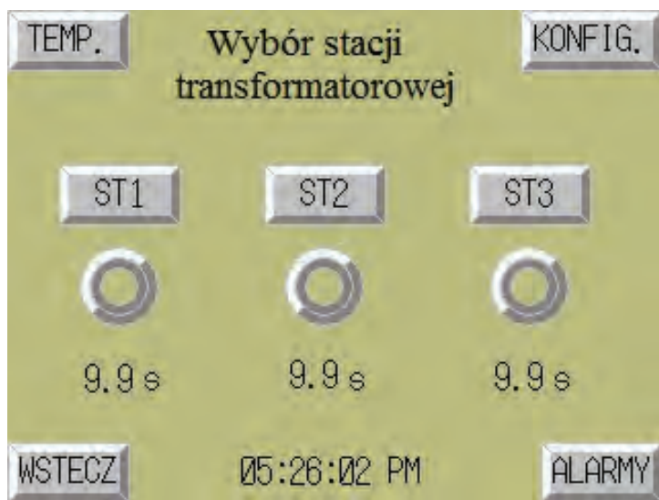
Rys. 3. Główne okno aplikacji SCADA Fig. 3. The main window of the SCADA application

odbywa się przez odpytywanie kolejnych stacji, przy czym czas na przesłanie odpowiedzi z pytanej aktualnie stacji nie przekracza 15 s. Gdy odpowiedź na zapytanie nie zostanie w tym czasie udzielona, program przechodzi do następnej stacji i wystawia błąd komunikacji stacji bieżącej.