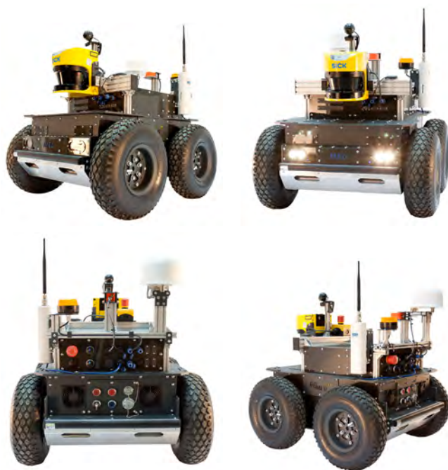
Rys. 4. Konstrukcja robota RoMegAT Fig. 4. RoMegAT robot design

mania znajduje się również na ręcznym sterowniku. System bezpieczeństwa może być również podłączony do przemysłowych sensorów (np. skanera laserowego ze zdefiniowanymi strefami bezpieczeństwa), które zatrzymają platformę awaryjnie, gdy przeszkoda nie zostanie zauważona przez system wysokopoziomowy i znajdzie się ryzykownie blisko robota.