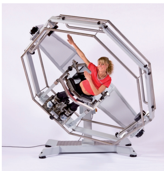
Rys. 11. Urządzenie do rehabilitacji Octagym Fig. 11. Rehabilitation device Octagym

System Manual-Reflexive Concept of Scoliosis Treatment (MRCST) to specjalnie przygotowana klatka o wymiarach 180 cm × 100 cm × 70 cm wyposażona w system pomiarowy