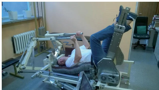
Rys. 15. Dynamiczny Korektor Kręgosłupa Fig. 15. Dynamic Spinal Corrector