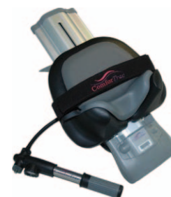
Rys. 8. Urządzenie ComforTrac Fig. 8. Medical device ComforTrac