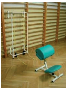
Rys. 2. Urządzenie do rehabilitacji AZBR Fig. 2. Rehabilitation device AZBR