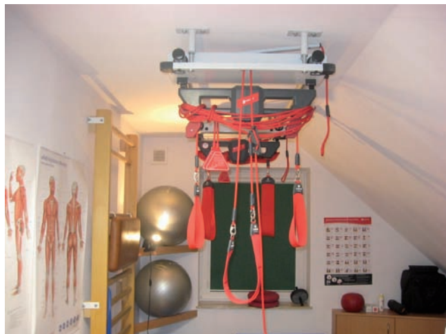
Rys. 9. Układ powieszania SET Fig. 9. Sling Exercise Device