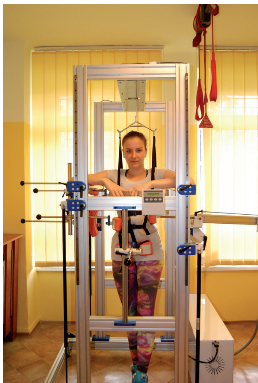
Rys. 14. Bezinwazyjne leczenie skolioz metodą FED Fig. 14. Non-invasive treatment of scoliosis by the FED method

dedykowana do wspomagania leczenia skolioz (Rys. 13). Dzięki systemowi pasów z napinaczami umieszczonymi po przeciwnych stronach urządzenia można wymuszać zginanie i boczne miednicy, rotację kręgosłupa, rotację i wychylenia obręczy barkowej [4, 5, 10].