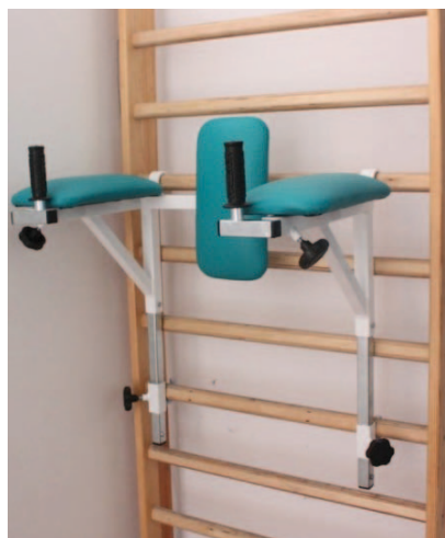
Rys. 5. Wyciąg grawitacyjny Pająk Fig. 5. Gravity lift Pająk

Do ćwiczenia retrakcji głowy oraz kręgosłupa szyjnego można skorzystać z urządzenia o nazwie Pingwin (Rys. 7). Regulacja położenia krzeselka zapewnia dobór odpowiedniej