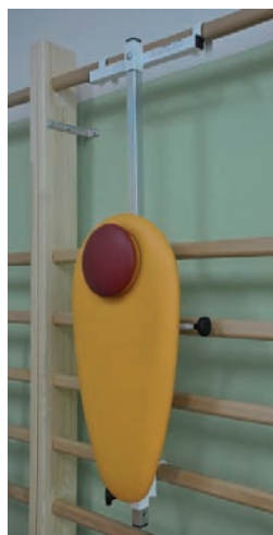
Rys. 7. Urządzenie do retrakcji głowy Pingwin Fig. 7. Head retraction device Pingwin