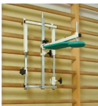
Rys. 3. Elongator Bocian Fig. 3. Elongator Bocian