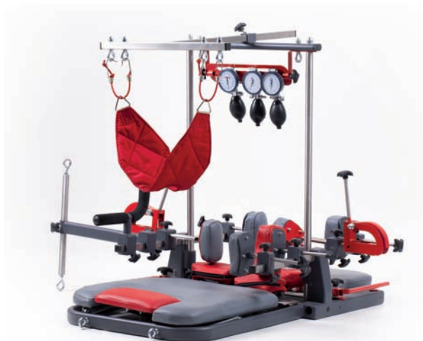
Rys. 12. Urządzenie do rehabilitacji w pozycji leżącej SKOL-AS Fig. 12. Rehabilitation device SKOL-AS