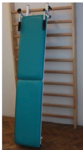
Rys. 6. Ławka symetryzująca Jaskółka Fig. 6. Symmetrifying bench Jaskółka