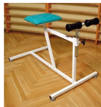
Rys. 4. Przyrząd do wzmocnienia mięśni grzbietu — Konik i Konik Plus Fig. 4. Device to activate back muscle — Konik i Konik Plus

z zestawu bloczków rehabilitacyjnych, tzn. miękkich obciążników o masie 1 kg zamocowanych na specjalnych zaczepach, co pozwala również na wykonywanie ćwiczeń ogólnorozwojowych.