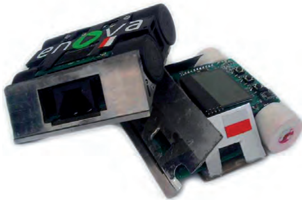
Rys. 1. Rezultaty zastosowania klinu na przykładzie robota Mirror podważającego robota Enova Fig. 1. Results of using a wedge on example of Mirror lifting other robot - Enova

w robotach zaczęto stosować szybkie silniki, umożliwiające uzyskanie prędkości ponad 1 m/s. Szybki atak, zanim klapki przeciwnika zdążyły opaść, oznaczał niemal pewną wygraną z bezbronnym przeciwnikiem. Wyjściem z tej sytuacji było zastosowanie klinów i widoczne zaostrenie konstrukcji z jednej strony. W taki klin wyposażony jest robot Mirror.