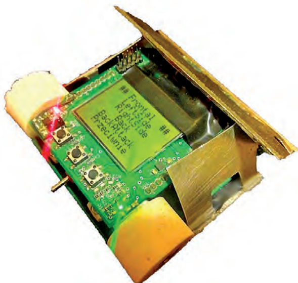
Rys. 3. Interfejs graficzny pozwalający na wybór strategii walki Fig. 3. Graphical interface used to choose a strategy for a fight

wybór strategii walki robota, ustawianie czasu oczekiwania przed rozpoczęciem walką i wybór maksymalnej prędkości robota. Wyświetlane są na nim także informacje o stanie naładowania baterii. Panel led wykorzystywany jest do wyświetlania stanów poszczególnych czujników robota. Pozwala to na upewnienie się, że robot znajdujący się na miejscu startu wykrywa przeciwnika, umożliwia proste dobranie progu czułości czujników podłoża bez użycia programatora. Najważniejszą zaletą jest jednak ułatwienie analizy przebiegu walki. Zapalone diody informują, które czujniki wykrywają przeciwnika, ułatwiają późniejszą poprawę algorytmów sterujących. Komunikacja za pomocą modułu bluetooth jest obecnie implementowana, docelowo będzie wykorzystywana do przesyłania wartości odczytów ze wszystkich czujników do komputera w celu dalszej analizy. Zastosowanie własnoręcznie skonstruowanego członu komunikacji z użytkownikiem zaoszczędziło wiele pracy, ułatwiło programowanie i sterowanie robotem.